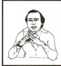
شكل رقم ٣

لاستخدامها ضد المتحدث لذا احذر هذه الجلسة ممن يستمع اليك.