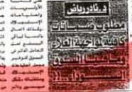
مطعم في مدينة الدار

في... زيادة مرتبات العاملين في الحكومة تساهم في رواج الأسواق