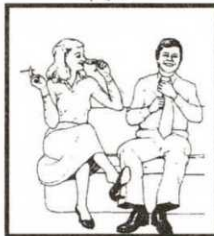
شكل رقم ٥

يحاول إيضاح أين كان. هكذا الرحتان المختلفتان قد تعطي الزوجة تلميحا بأن زوجها لايقول الحقيقة.