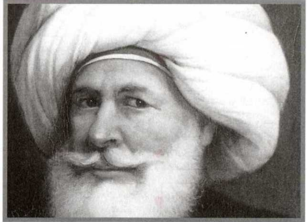
الصورة الرسمية لمحمد علي باشا

إنه فعل أشياء وأشياء والذي استطاعه كثير، والذي بناه وشيده وغيره كثير، فلقد زرع، ودخل الصناعة، وباع واشترى، وحارب وجننا لتنظر على ما فعله.. واحترار الاقتصاديون فيما أقدم