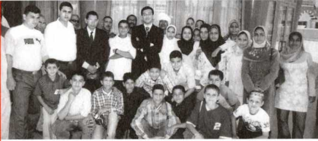
لقطة جماعية لطلبة المدرسة والمدرسين بمدينة دريم بارك الترفيهية