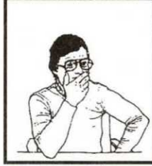
شكل رقم ٢

هناك المثات من الإشارات الجسدية التي يتعرض لها الكتاب ويحاول أن يعطي القارئ معناها مثل حركات العين وطريقة الجلسة أو الوقفة أو حتى اتجاه الأقدام، وإذا كان اهتمام الأفراد بهذه اللغة ومدلولاتها قد لا يكون كبيرا، فإن هناك جهات تهتم بشدة بترجمة لغة الجسد مثل أجهزة المخابرات التي يعينها كثيرا أن تدرس الأشخاص الذين تتعامل معهم أو تقوم بمتابعتهم، كما أن المؤسسات الكبرى الآن تعتمد كثيرا على مدلولات لغة الجسد قبل الأقدام على تعيين موظفيها، فالمقابلات الشخصية لاتكون فقط لجمع معلومات شوفية من المتقدم للوظيفة، بل فرصة للتعرف على أبعاد شخصيته من خلال حركاته وإيماءاته.