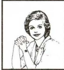
شكل رقم ٤