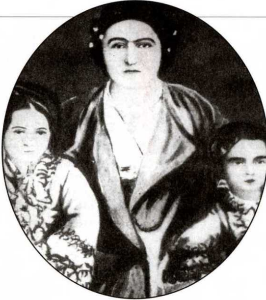
زبية قادن هانم زوجة محمد علي باشا بصحبة ابنتيها

لحسابهم الخاص، وجعلهم يتكالبون على الخدمة في تجمعات الميرى!!