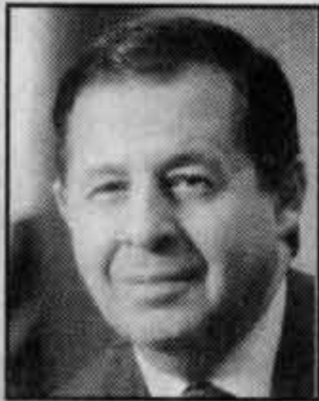
رشيد محمد رشيد